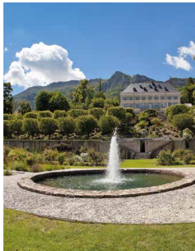
Domaine de Charance