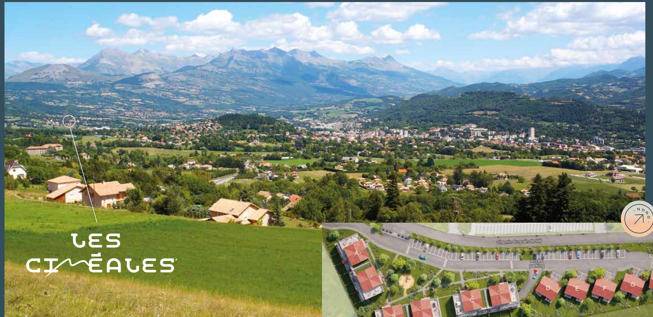
Vue de Gap depuis les hauteurs en provenance de la Freissinouse

Épicentre économique des Alpes du Sud, Gap est aussi une ville de travail, boostée par le technopôle de Micropolis et la zone d'activités de Tokoro . Pour faciliter les déplacements des actifs, des scolaires, des familles, l'agglomération a développé un réseau de bus dense et totalelement gratuit .